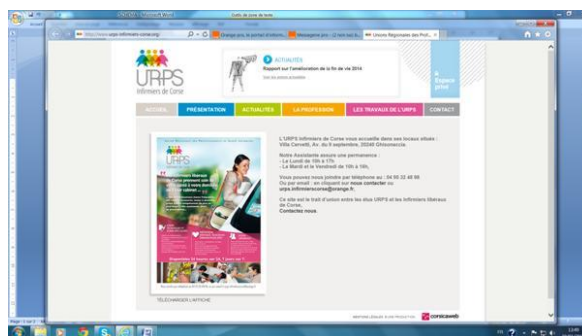
Site internet : www.urps-infirmiers-corse.org

⇒ et des sessions de formation (4) pour les élus , autour d'une conseillère en santé publique, pour travailler sur la représentation, la communication et le développement de projets